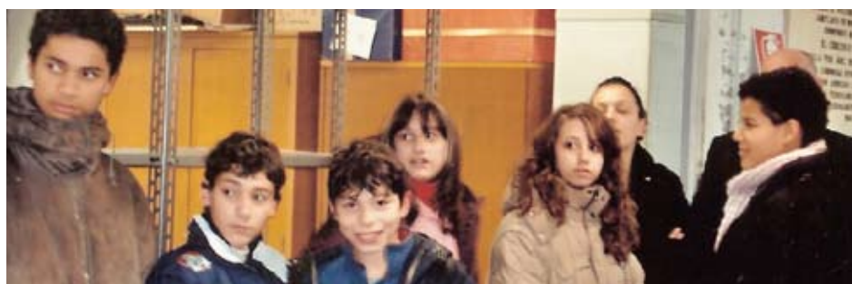
I Ragazzi della Parrocchia di Santomoro in visita allo Spaccio della Solidarietà