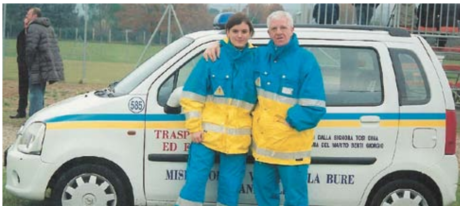
L'assistenza Sanitaria alla partita di calcio è stata garantita dai volontari della Misericordia di Valle della Bure e Candeglia.

partita pari a 200 Euro è stato devoluto allo "Spaccio della Solidarietà" per contribuire all'assistenza dei tanti bisognosi della nostra Città. Il responsabile dello "Spaccio" nel ringraziare sentitamente gli organizzatori ed i partecipanti sottolinea l'importanza di tali iniziative che offrono momenti di svago e socializzazione ed allo stesso tempo sensibilizzano i più giovani ad avere attenzione per le persone meno fortunate, che nel mondo frenetico di oggi sono sempre più emarginate.