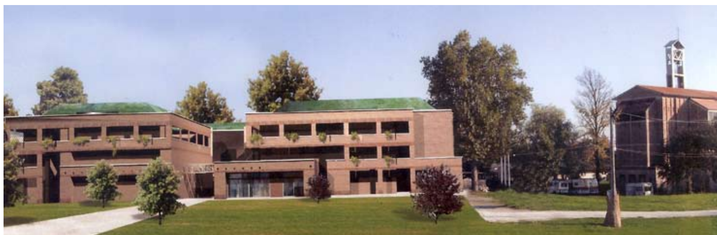
Elaborazione computerizzata del progetto da realizzare nell'area del Parco La Vergine

Per concludere penso che la Misericordia oggi come ieri, debba sempre di più rilevare le esigenze della sua popolazione e con il criterio della sussidiarietà agli enti pubblici istituzionalmente preposti, intervenire con sollecitudine nelle emergenze socio sanitarie che il cittadino presenta.