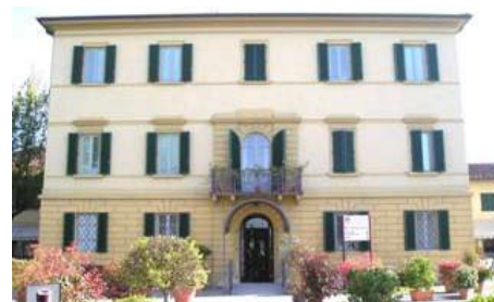
Poliambulatorio della Misericordia di Pistoia

Sempre nell'anno 2005, abbiamo siglato un contratto di locazione con la ASL per la messa a disposizione dei locali del vecchio poliambulatorio, dove vi sono state trasferite alcune attività del territorio.