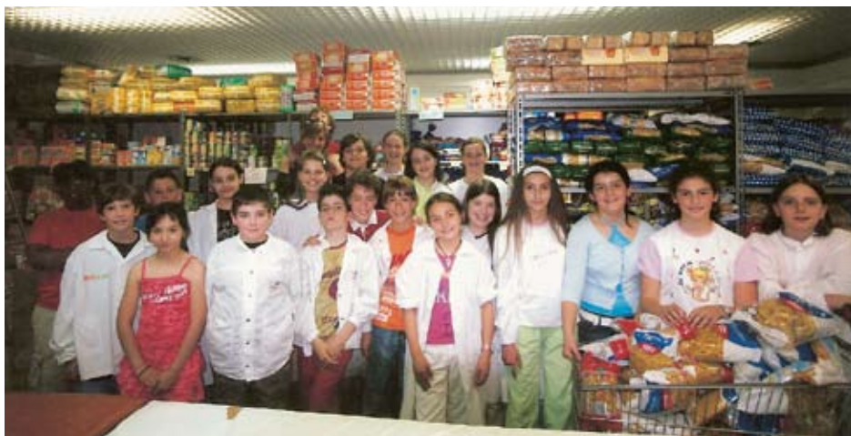
Gli alunni della 5ª elementare dell'Istituto Suore Mantellate di Pistoia