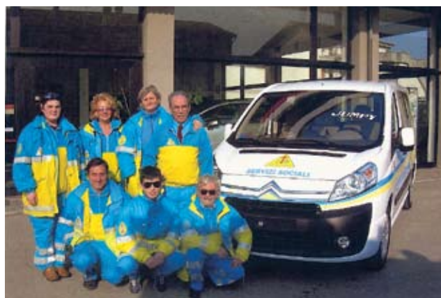
Un gruppo accanto al nuovo automezzo per i trasporti disabili

Il nostro staff dirigenziale ci è riuscito a pieni voti. La vettura è stata acquistata, su delibera del Consiglio Direttivo, presso la concessionaria "Citroën Autoequipe srl" di Pistoia che ha collaborato per ottimizzare la scelta del mezzo in base alle necessità e le esigenze prospettate dalla Confraternita.