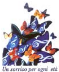
Un sorriso per ogni et 