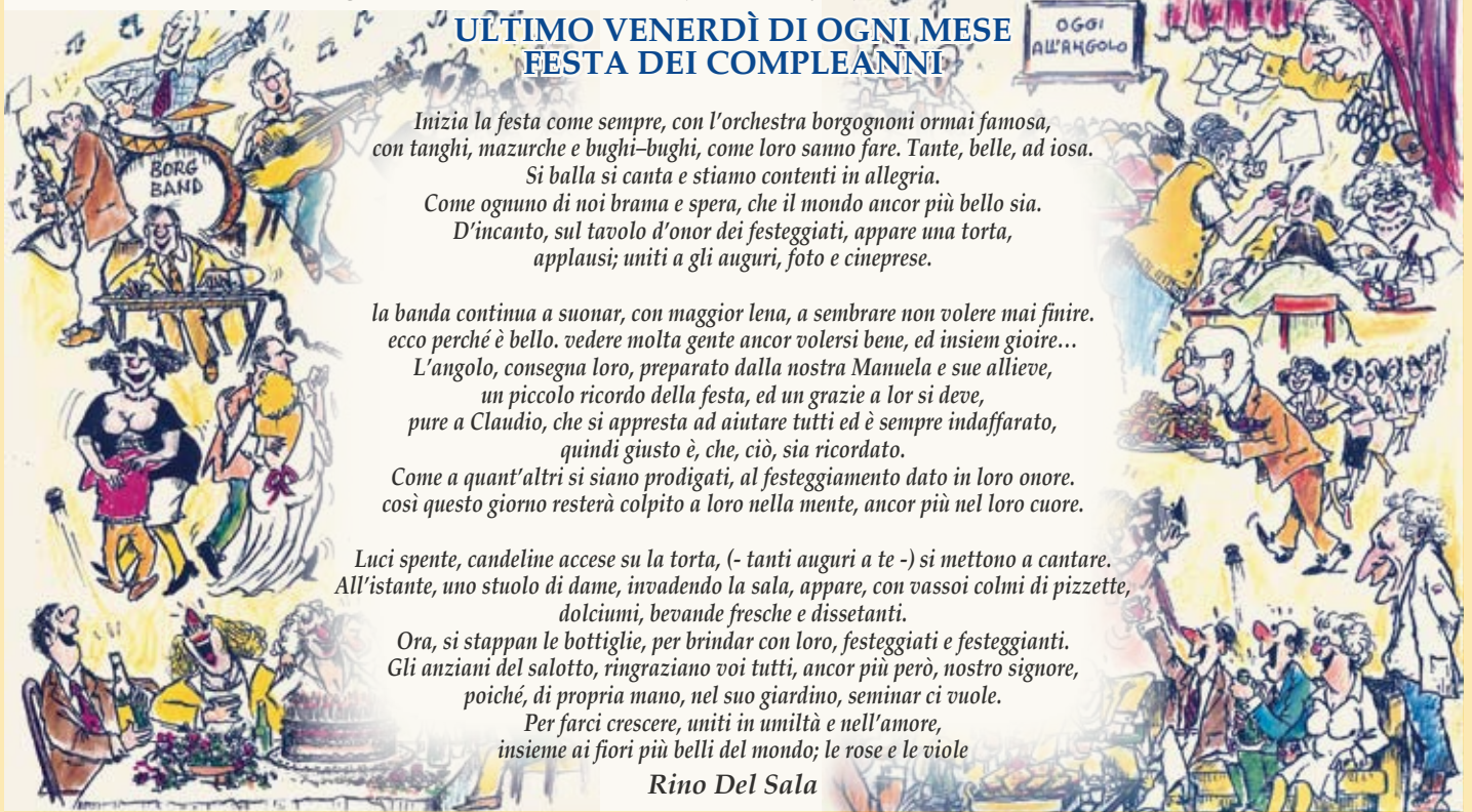
Vignette di Fabio Bacci