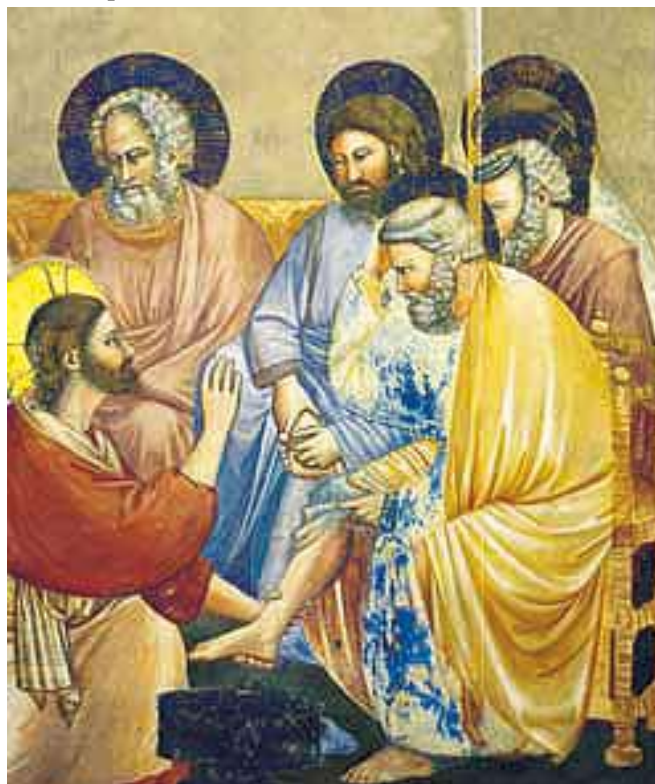
Lavanda dei piedi, Giotto - Cappella degli Scrovegni, Padova

questa civiltà occorre che si radichi profondamente sulla filosofia del vangelo e sul modo di intendere il servizio come lo intende Gesù. I volontari cattolici devono dunque coltivare un rapporto profondo con il Signore attraverso l'Eucarestia e attraverso questo rapporto l'energia dell'Amore che libera e dona dignità potrà dilagare attraverso i vari servizi che essi realizzano nella realtà e