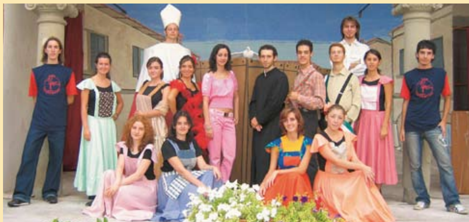
La compagnia amatoriale teatrale Dreamers che metterà in scena il musical