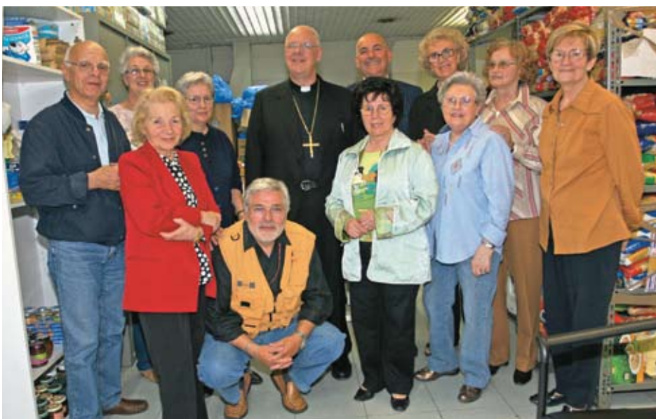
Alcuni volontari dello Spaccio Solidarietà con il Vescovo di Pistoia, Mons. Mansueto Bianchi

Anche in occasione delle feste Natalizie dell'anno appena trascorso si è svolta la tradizionale festa di Babbo Natale per i bambini delle famiglie assistite dai centri della Caritas Diocesana di Pistoia. La novità di quest'ultima iniziativa è stata che per la realizzazione si sono unite le forze di varie Associazioni quali l'ANT (Associazione Nazionale Tumori), il Centro Stranieri San Martino de Porres e lo Spaccio della Solidarietà della nostra Istituzione. Ogni Associazione ha messo a disposizione mezzi e volontari per preparare al meglio l'accoglienza per i piccoli, che con molto entusiasmo hanno salutato l'arrivo con i doni di Babbo Natale, il quale, da parte sua, non ha fatto mancare a nessuno un momento di felicità confezionando e regalando palloncini a forma di varie figure. Dobbiamo ringraziare tutte le famiglie, che sensibilizzando i loro piccoli, hanno portato alle nostre sedi i giocattoli non più