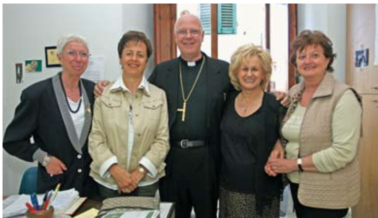
Il Vescovo di Pistoia, in visita alla sede ANT con alcune volontarie