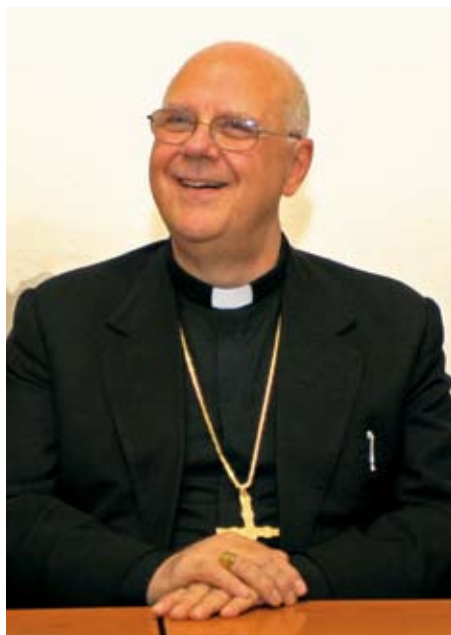
Mons. Mansueto Bianchi Vescovo di Pistoia

Il breve incontro ha stimolato un confronto su obiettivi e realtà della Diocesi, in rapporto con le problematiche della città. Il nostro Vescovo, rispondendo alle domande, ha osservato che la diocesi, di base, è molto presente e vicina alle problematiche sociali ma che può e deve fare di più per migliorare il tipo di servizio e di risposta da dare alla gente. « Si tratta – ha chiarito – di puntare su una pastorale integrata o in rete: le parrocchie devono lavorare insieme, esprimendo dei servizi che si integrino reciprocamente. Un secondo punto su cui puntare poi, è la qualità delle relazioni e il rapporto tra la Diocesi e la gente che deve essere "caldo". La parrocchia è la casa delle persone