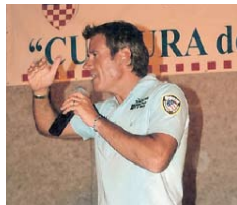
Jimmy Ghione, di striscia la notizia, ospite alla Festa della Misericordia