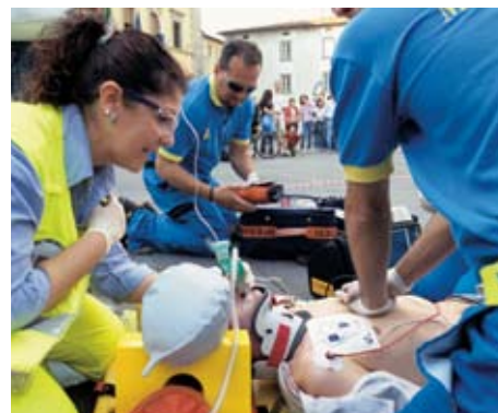
Un momento della simulazione in Piazza del Duomo a Pistoia.

tore Marcello Lazzerini Giornalista Rai)