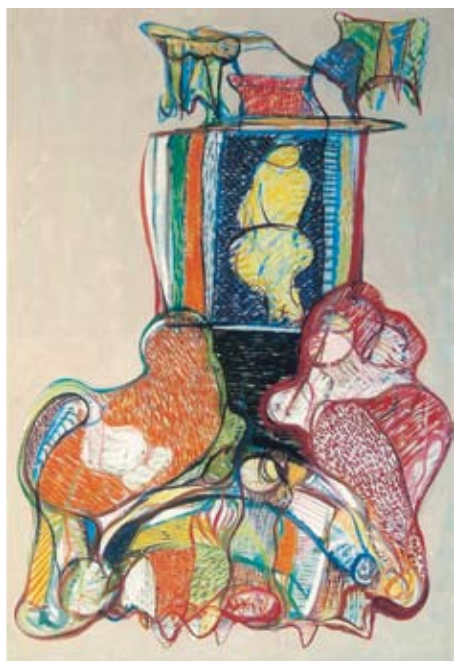
Flavio Bartolozzi 1984 - Omaggio a Michelangelo