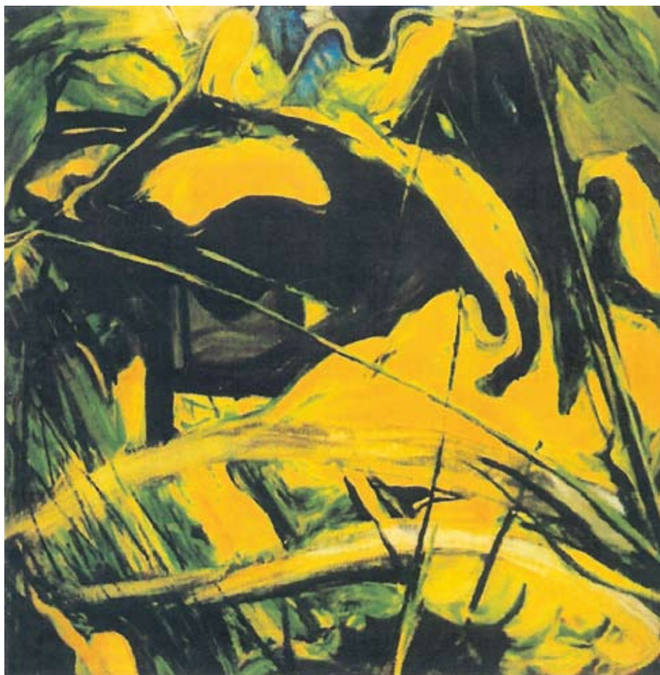
opera di Michele Misiano Lastraioli - senza titolo

Svariate sono state le iniziative di questa galleria, quanto molteplici sono stati gli artisti selezionati per le esposizioni, "non vi sono stati criteri precisi o parametri prestabiliti sulle