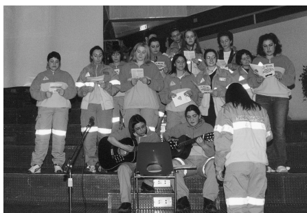
Volontari della Misericordia

menti per i turni di notte e per alcuni volontari che si sono distinti per il numero consistente di servizi espletati.