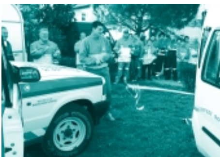
Un momento della cerimonia

E' seguita la Messa, celebrata da Don Carlo, Parroco di Gello, correttore spirituale della nostra Sezione e spesso anche Volontario, che durante l'omelia ci ha toccato il cuore con le sue parole facendo riferimento al messaggio per la Quaresima di Papa Giovanni Paolo II, che invita alla riflessione con la frase tratta dagli Atti degli Apostoli " Vi è più gioia nel dare che nel ricevere " e alla preghiera di Madre Teresa di Calcutta " Vuoi le mie mani? ", che abbiamo citato anche nei nostri biglietti di invito per