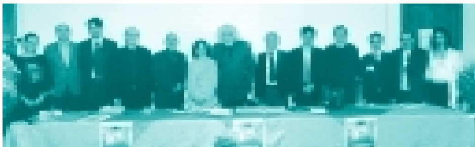
Relatori e organizzatori del convegno

Convegno ANS alla Misericordia di Pistoia